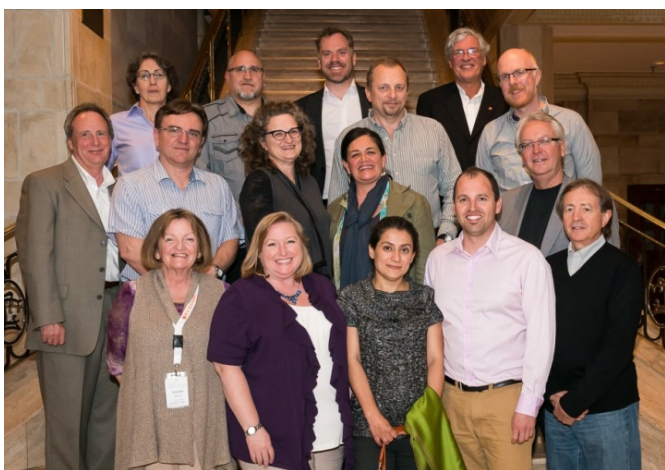
CSLA Board of Directors | CA de l'AAPC