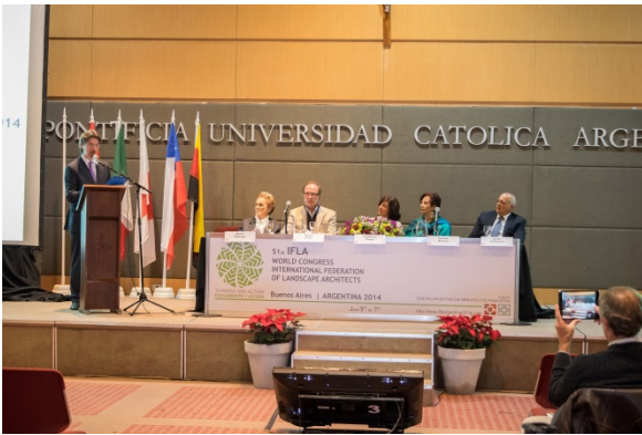
2014 IFLA World Congress, Argentina