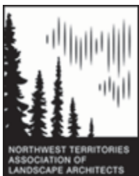
Northwest Territories Association of Landscape Architects (NWTALA)