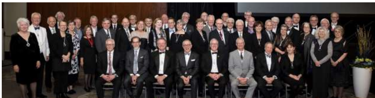
Fellows assembled at the 2018 investiture ceremony in Toronto. | Associés rassemblés à la cérémonie d'intronisation 2018 qui a eu lieu à Toronto.