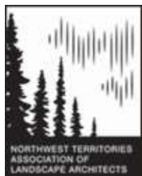
Northwest Territories Association of Landscape Architects (NWTALA)