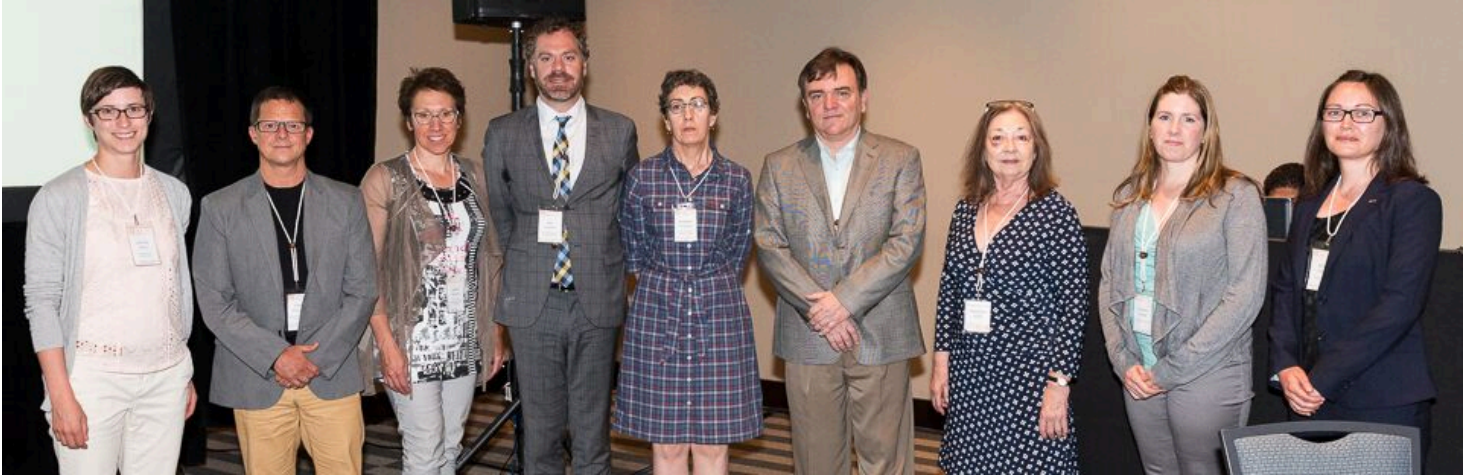
Representatives from all CSLA component associations sign the Terms of Reference at the CSLA Annual General Meeting held in Mexico in May, 2015. | Représentants des associations constituantes de l'AAPC signent l'entente avec l'AAPC à la réunion annuelle générale de l'AAPC qui a eu lieu au Mexique en mai 2015.