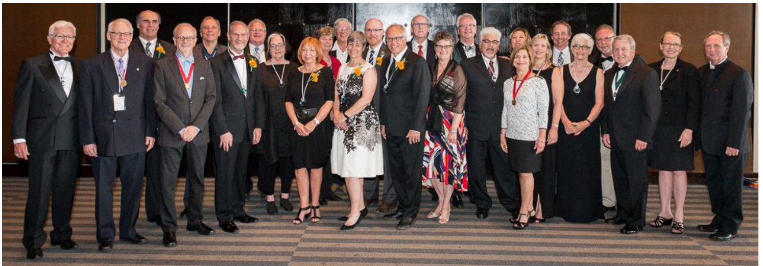
Fellows assembled at the 2016 investiture ceremony in Mexico. | Associés rassemblés à la cérémonie d'intronisation 2016 qui a eu lieu à México.